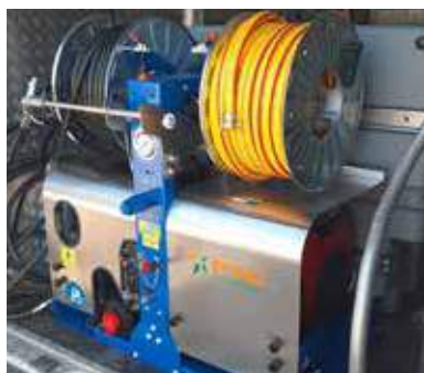
Version Standard Standard Version