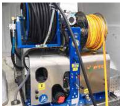
Version avec enrouleur de tuyau électrique Version mit elektrisch angetriebener Schlauchtrommel