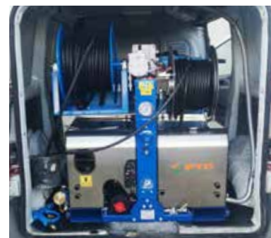
Version avec 2 enrouleurs de tuyau 2 HP (électrique et manuel) Version mit 2 HP Schlauchtrommel (elektrisch und manuel)