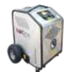
100 kW-12 VDC générateur auxiliaire mobile d'eau chaude Heisswasser 100 kW-12 VDC Mobilgenerator